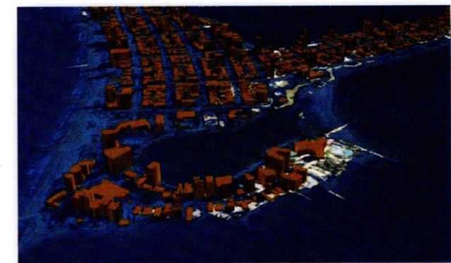
Figura 4. Escenario de inundación recreado para el sector de "El Laguito" (Cartagena de Indias D. T. y C.)