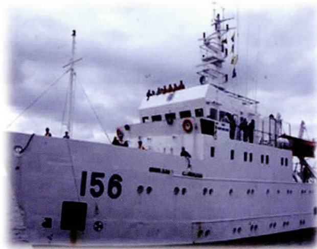
Figura 1. Buque Oceanográfico ARC Malpelo