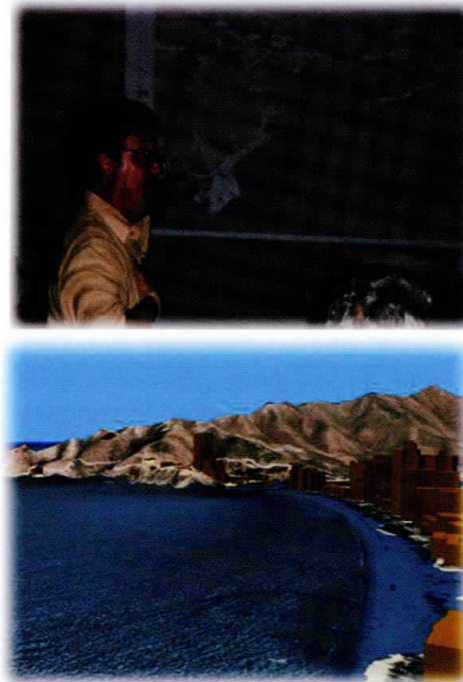
Figura 5. Socialización escenario de inundación recreado para áreas urbanas de Santa Marta, D.T.C. e H.