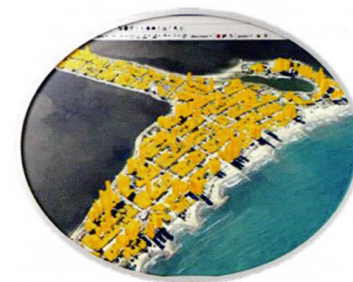
Figura 3. Ejemplo mapa tridimensional elaborado con datos LIDAR